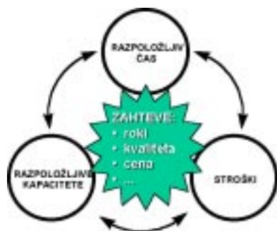
Slika 1: Omejitve, ki determinirajo uspe{nost proizvodnih procesov Figure 1: Limiting factors for successful production processes

Da bi bilo to izvedljivo, morajo biti izpolnjeni nekateri temeljni pogoji. Eden od njih je u-inkovit proiz- vodni informacijski sistem. Ta mora biti sestavni del in- formacijskega sistema podjetja, ki temelji na urejenih